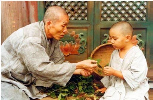
Il film "Primavera, estate, autunno, inverno e ancora primavera" ha come soggetto il rapporto tra maestro e allievo, segnato dalla ciclicità del tempo.

Per tale ragione le qualifiche di un allievo non sono determinate da un apprendimento formale determinato da didattiche e colori di cintura. Bensì si valuta l'allievo dallo spirito che è insito in esso. La trasmissione dell'insegnamento avviene solo in linea diretta e trascende dal concetto che ciò si possa acquistare. L'insegnamento si fonda sul valore dei meriti. I meriti non scaturiscono dalle cose che si possono offrire, ma dalla crescita che ogni essere è in grado di comprendere.