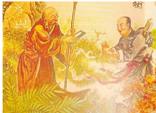
Uno studente che voleva imparare le arti marziali chiese a un Maestro "Voglio imparare le arti marziali, se sarò un sincero studente, quanto tempo mi ci vorrà per essere maestro?" Il Maestro rispose "10 anni". Lo studente allora disse "Io voglio imparare più velocemente. Se mi impegnerò di più e sarò regolare nella pratica, quanto tempo mi ci vorrà?" Il Maestro ponderò la domanda e rispose "20 anni". Racconto cinese.

Pertanto mi limiterò a definire tali stadi dal punto di vista di un maestro, che è stato e sarà sempre allievo nei confronti di un'arte, che come la vita stessa non si esprime attraverso le forme, i gesti e le azioni, bensì attraverso i valori, i principi e l'immaginario che tanto sono in grado di cogliere l'animo umano e non gli occhi di chi le osserva. In questo modo il mio ruolo sarà quello di aprire la mente dello studente ed indurlo a pensare affinché la sua percezione vada oltre il limite dell'oggetto e delle parole qui riportate.