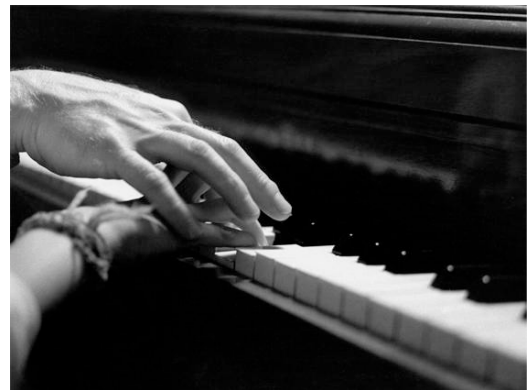
... affinché l'arte risorga sempre dalle radici profonde nel genuino inizio.

Egli è prima d'ogni cosa l'allievo e senza perderne lo spirito ne infonde il verbo affinché l'arte risorga sempre dalle radici profonde nel genuino inizio.